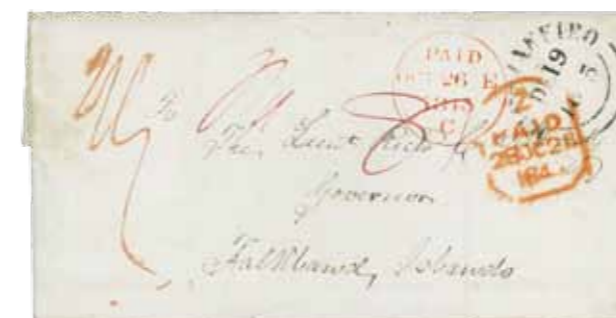
1. Una delle prime lettere in arrivo alle Falkland da Londra: datata 1845, era indirizzata al governatore Richard Moody. È stata aggiudicata all'asta Grosvenor il dicembre scorso per 5 mila sterline (€ 5.900 circa)

Prima di allora, la scarsa popolazione – ancora oggi non vi abitano più di 3.000 persone, dedite all'allevamento delle pecore e alla pesca – riceveva e inviava posta tramite navi e baleniere di passaggio, che provenivano o ripartivano in direzione del Brasile, via Montevideo (foto 1).