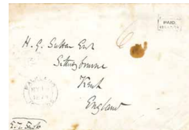
2. Busta del 1874 con uno dei primi franks

Dieci anni più tardi apparvero i primi dentelli adesivi, stampati su carta gommata senza filigrana. Riportavano l'effigie della regina Vittoria nei tre valori facciali da 1 penny, 6 pence e 1 scellino, seguiti l'anno successivo dal 4 pence (foto 3).