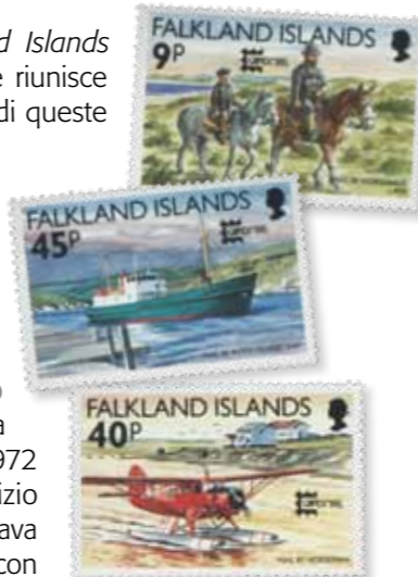
6. 7. 8. I diversi mezzi di trasporto impiegati per trasporto della corrispondenza nell'arcipelago