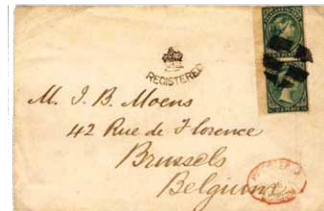
3. La prima busta nota con i francobolli delle Falkland