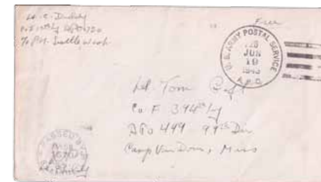
1. Busta spedita in franchigia militare il 19 giugno 1943 da un soldato di stanza ad Attu, identificata con l'annullo «Apo 726»

di Chicago Harbor e la valle sottostante. Due giorni dopo tutti i giapponesi erano morti, compresi quelli che si suicidarono usando le bombe a mano. Tra gli americani si contarono più di cinquecento morti e oltre mille feriti.