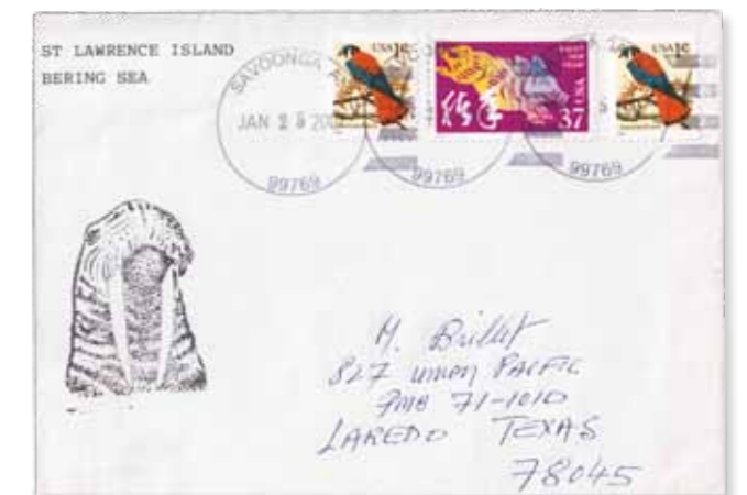
7. Busta dell'isola di St. Lawrence del 25 gennaio 2007 con annullo di Savoonga AK 99769

6. Busta con annullo della nave statunitense U.S.S. Kingfisher del 20 maggio del 1935 recante l'indicazione dell'isola Segula fra le barre del timbro e con cachet «Third Aleutian Island survey 1935 U.S. navy»