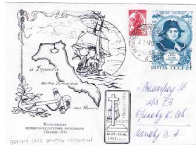
3. La cover che commemorò la spedizione Bering 1991

tate dai discendenti dei cacciatori di foche provenienti dalla penisola della Kamchatka. Le Aleutine dividono il mare di Bering dall'oceano Pacifico, e formano un lunghissimo arco di circa tremila chilometri costellato da più di trecento isole vulcaniche che si prolunga fino a congiungersi con la penisola dell'Alaska. L'arcipelago è composto da sei gruppi distinti di isole. Immaginando un ipotetico viaggio da ovest a est dell'arcipelago, il primo gruppo su cui ci si imbatte – quello per intenderci più vicino all'Asia – è il gruppo delle Commander. A questo gruppo appartiene l'isola di Bering, scoperta nel 1741 dal navigatore danese Vitus Bering – esploratore di diverse zone artiche per conto dello zar Pietro I – che vi morì qualche mese dopo esservi naufragato insieme al suo equipaggio. L'isola, all'epoca disabitata, fu battezzata nel 1826 con il nome dello sfortunato comandante. I marinai sopravvissuti al naufragio tornarono in Russia e raccontarono di aver scoperto alcune isole abitate da numerosi animali da pelliccia. Iniziò così la caccia alle foche in tutto l'arcipelago che provocò anche dure contese con gli aleuti, gli eschimesi arrivati dalla Siberia che abitavano quelle zone da circa due millenni. Nel 1991 una cover sovietica (foto 3) commemorò la spedizione Bering 1991 , organizzata per cercare le spoglie dell'esplora-