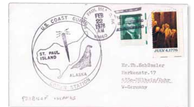
8. Una busta dell'isola di St. Paul, che nel 1978 era sede di una stazione di controllo aereo