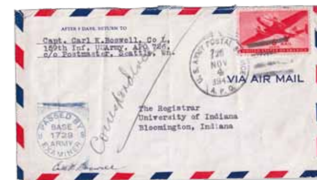
2. Busta inviata il 4 novembre 1943 da Attu all'università dell'Indiana, previo controllo, come mostra l'annullo Army Examiner , della censura militare

In pochi ricordano questo tragico capitolo della Seconda guerra mondiale, un episodio drammatico con una peculiarità: è stato l'unico scontro sul fronte Pacifico avvenuto sul suolo del continente nord-americano. Le isole Aleutine, che si trovano nel nord dell'oceano Pacifico, fanno infatti parte dell'Alaska e sono americane fin dal 1867, quando gli Stati Uniti acquistarono dalla Russia, per 7,2 milioni di dollari, il loro quarantanovesimo stato. Solo le isole Commander sono rimaste russe, e sono ancora abi-