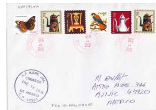
5. Busta con annullo di Dutch Harbor AK 9962

Nel bacino del mare di Bering vi sono altre isole statunitensi appartenenti all'Alaska tra cui le Pribilof Islands, St. Lawrence Island, Diomed Islands, King Island, St. Matthew Island, Karaginsky Island e Nunivak Island. Queste isole sono state mete di diverse spedizioni esplorative negli anni Trenta, documentate da buste affrancate (foto 6-8) dove gli annulli raccontano di destinazioni estreme verso cui anche i collezionisti, con una sorta di viaggio filografico, possono avventurarsi. ■