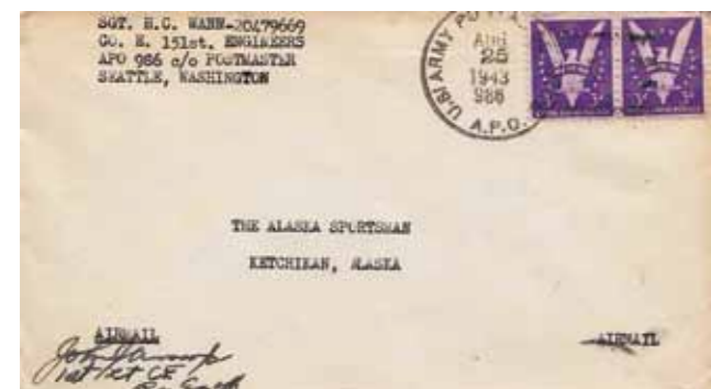
4. Busta con annullo militare «Apo 986», proveniente dall'isola di Amchitka